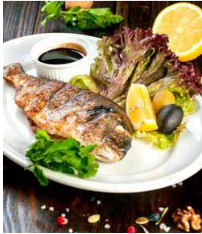
«СТЕЙК ИЗ СЕМГИ НА ГРИЛЕ» ...1300 р. семга, баклажан, перец, кабачок, сливки, зелень, домашний соус, 350 г