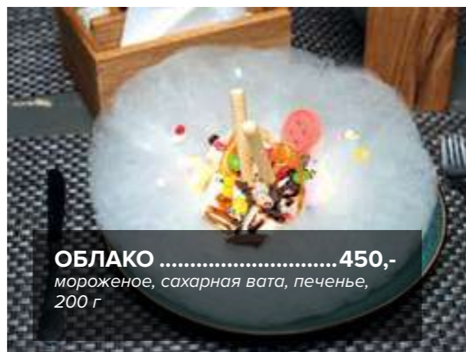
ОБЛАКО ..... 450,- мороженое, сахарная вата, печенье, 200 г