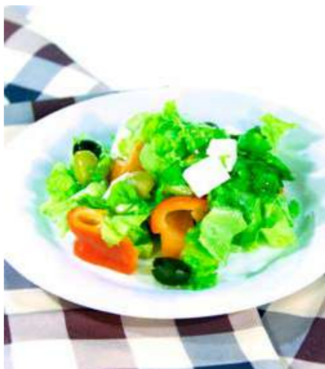
«ГРЕЧЕСКИЙ».....650.- свежие огурец, помидор и болгарский перец, сыр фета, оливковое масло, 190 г