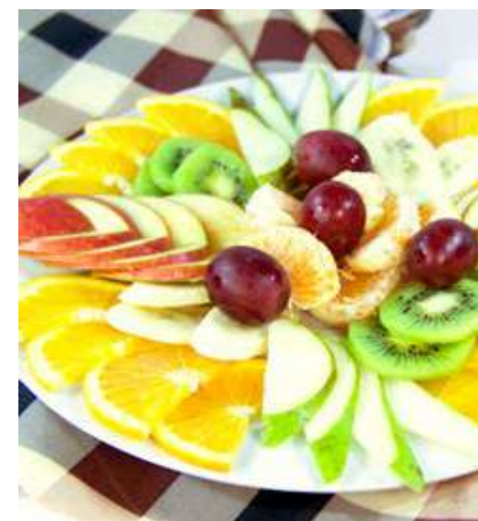
ФРУКТОВАЯ ВАЗА.....790.- яблоко, груша, апельсин, мандарин, киви, виноград, 600 г