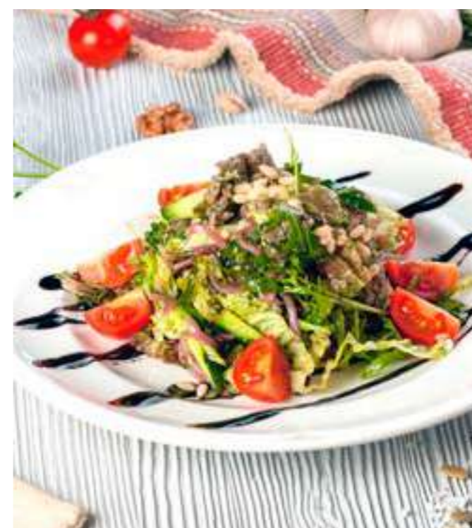
«АРАМИНА» ..... 750.- говядина, руккола, лист салата, черри, свежий огурец, лук, кедровый орех, соусы песто и бальзамический, 200 г