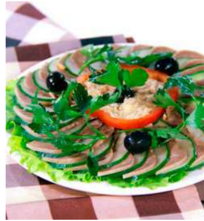
СЮРПРИЗ ..... 750.- язык отварной, хрен, свежий огурец, горчица, 150/100/50 г