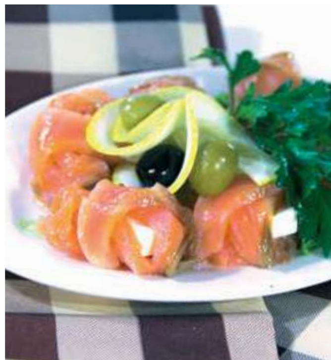
РУЛЕТКИ ИЗ СЕМГИ ..... 1100.- С МЯГКИМ СЫРОМ семга с/с, сыр фета, зелень, 6 шт.