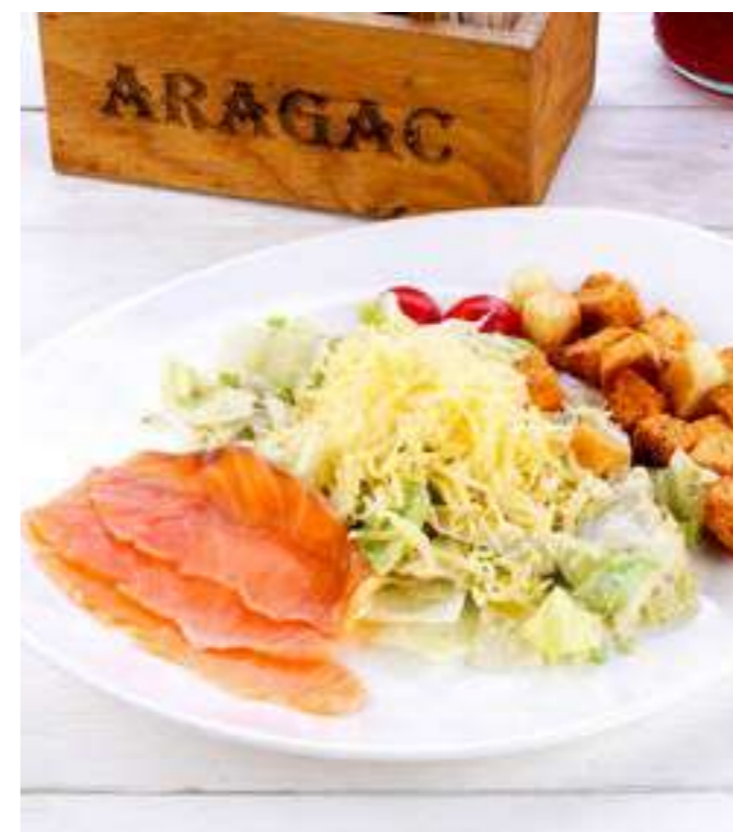
ЦЕЗАРЬ С СЕМГОЙ .....890.- семга, айсберг, пармезан, черри, соус чесночный, сухарики, 250 г