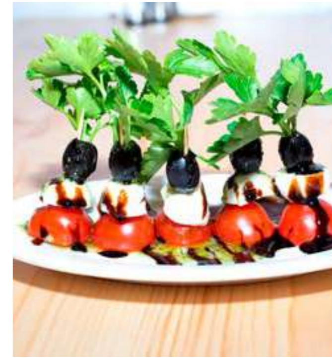
КАПРЕЗА ..... 550.- фетакса, помидор, маслины, соус песто, 6 шт.