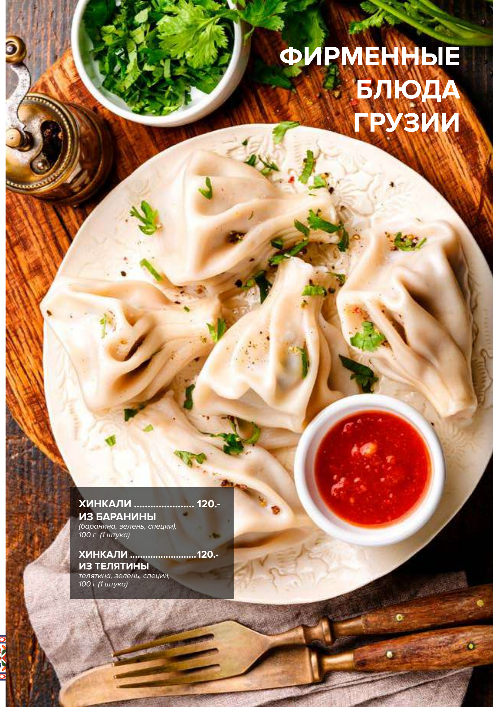
ХИНКАЛИ ..... 120.- ИЗ БАРАНИНЫ (баранина, зелень, специи), 100 г (1 штука)