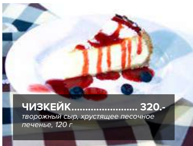
ЧИЗКЕЙК ..... 320.- творожный сыр, хрустящее песочное печенье, 120 г