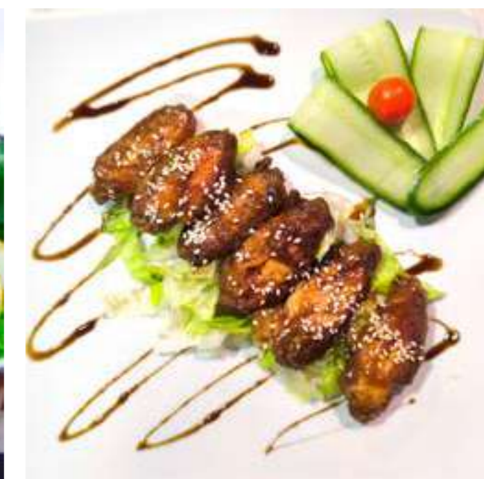
МЕДОВЫЕ КРЫЛЬЯ..... 690.- пикантные крылья, кисло-сладкий соус, кунжут, айсберг, свежий огурец, 220 г