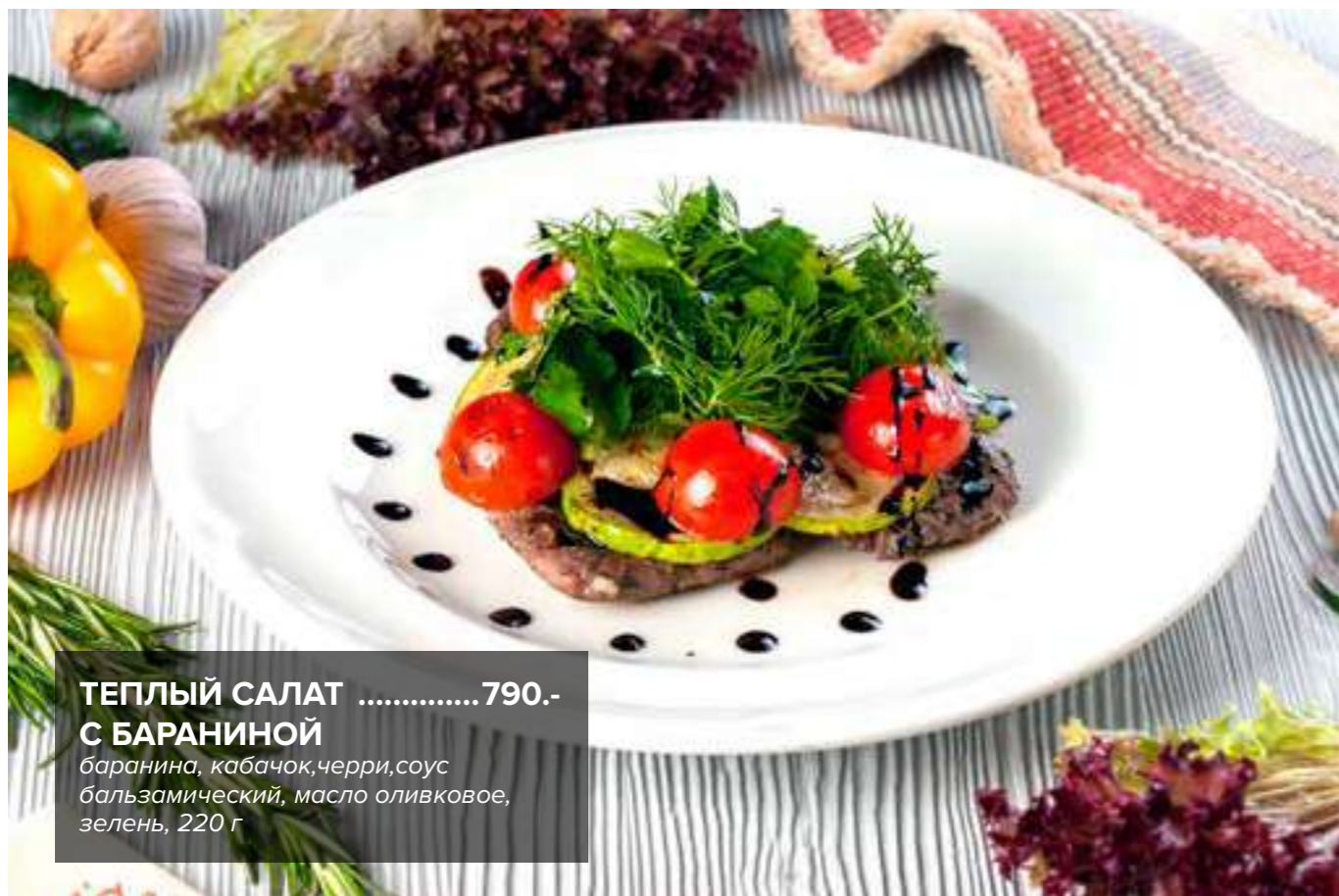
ТЕПЛЫЙ САЛАТ .....790.- С БАРАНИНОЙ баранина, кабачок, черри, соус бальзамический, масло оливковое, зелень, 220 г