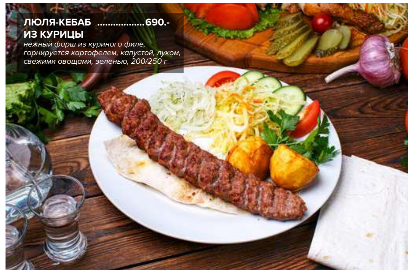
ЛЮЛЯ-КЕБАБ ..... 690.- ИЗ КУРИЦЫ нежный фарш из куриного филе, гарнируется картофелем, капустой, луком, свежими овощами, зеленью, 200/250 г