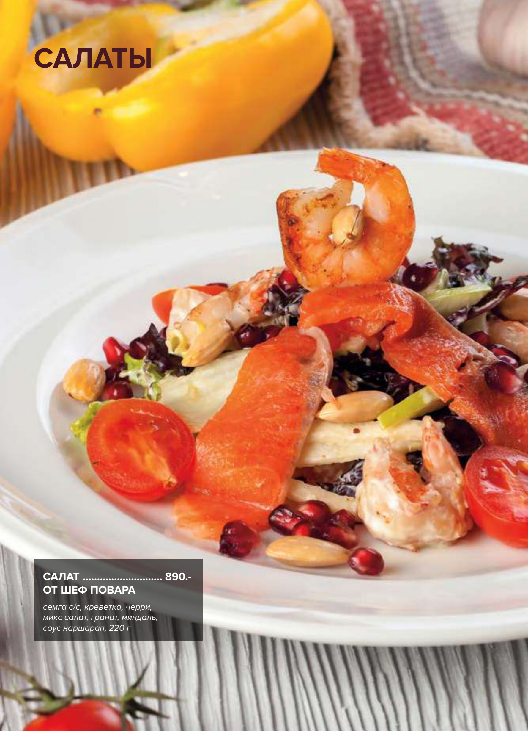
САЛАТ ..... 890.- ОТ ШЕФ ПОВАРА

семга с/с, креветка, черри, микс салат, гранат, миндаль, соус наршарап, 220 г