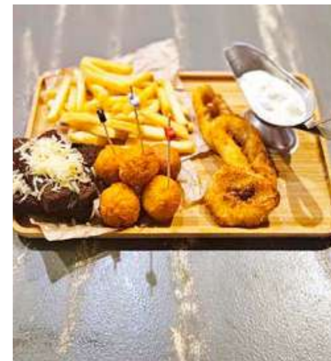
АССОРТИ ПИВНОЕ ..... 990.- греники, сырные шарики, фри, кольца кальмаров, косичка, соус домашний, 350 г