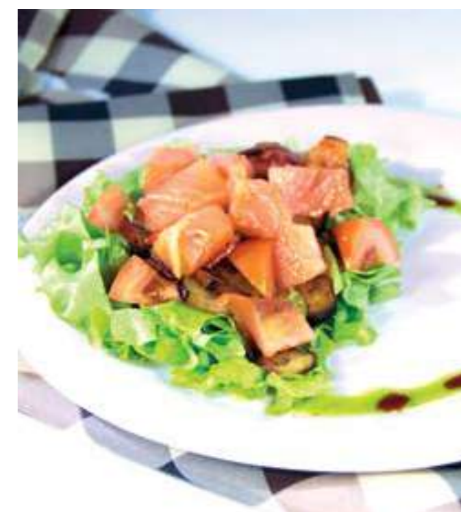
«БРИЗ» ..... 890.- семга, баклажан, болгарский перец, лист салата, подсолнечное масло, соусы соевый и наршарап, 210 г