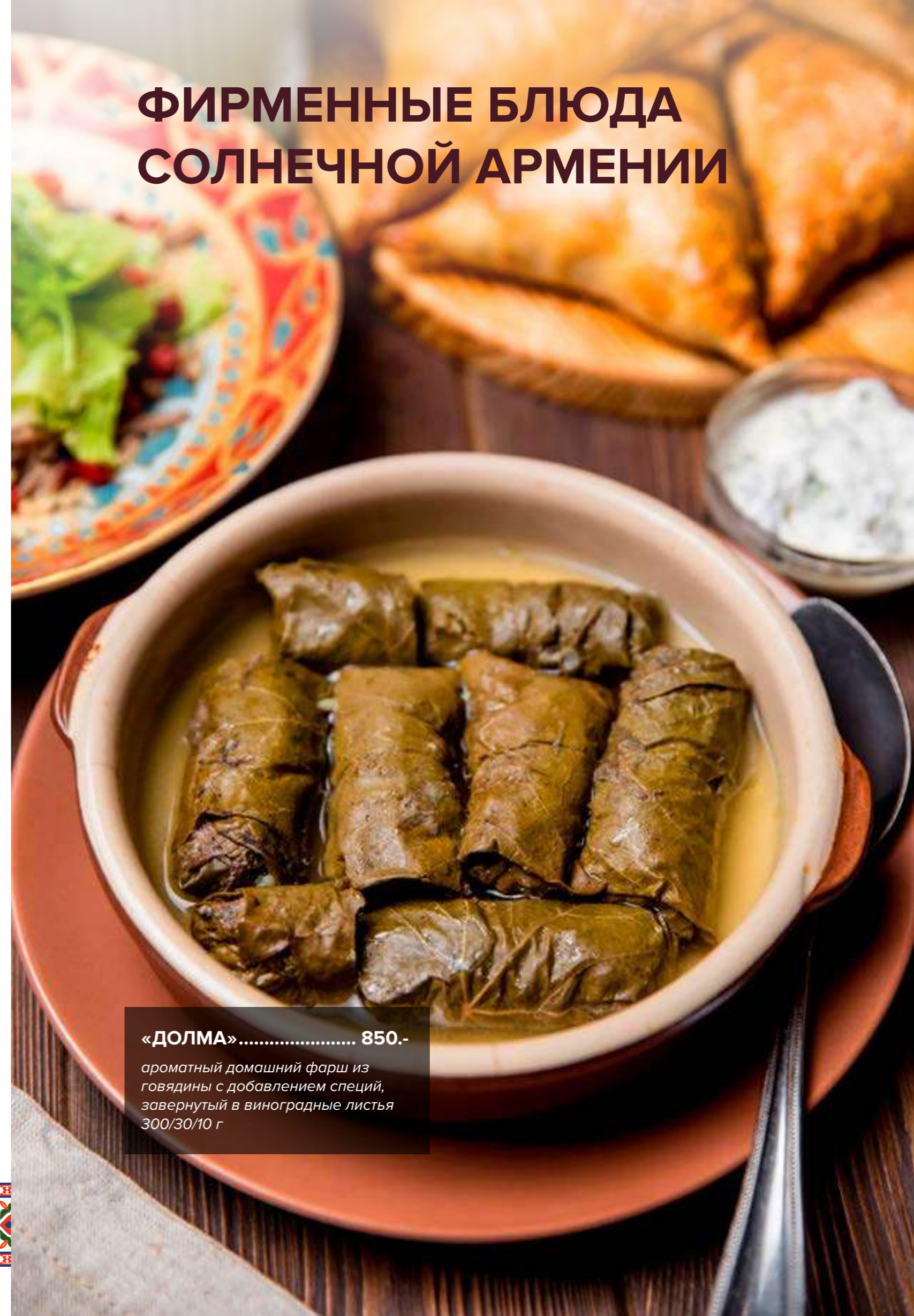
«ДОЛМА» ..... 850.- ароматный домашний фарш из говядины с добавлением специй, завернутый в виноградные листья 300/30/10 г