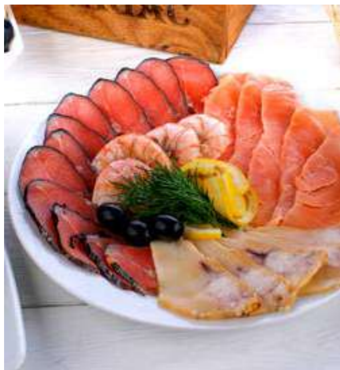
РЫБНЫЙ УЛОВ ..... 1200.- семга с/с, горбуша, балык масляный, креветки, 330 г