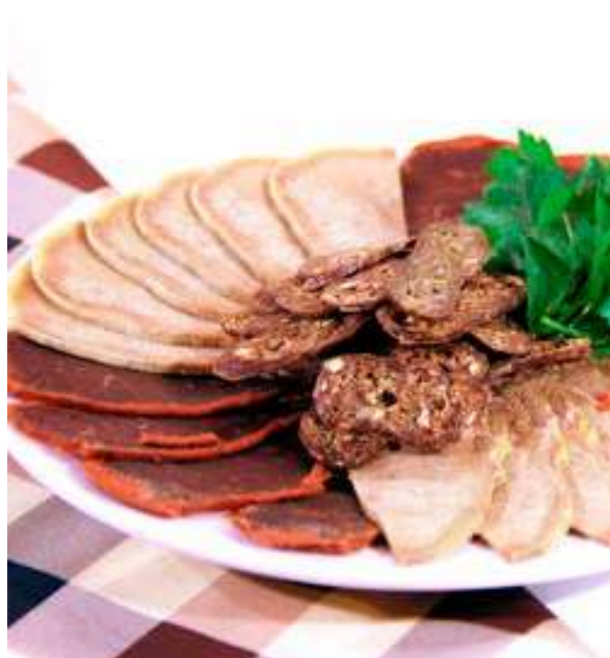
МЯСО ПО-АРМЯНСКИ ..... 1100.- суджук, бастурма и говяжий язык, 220 г