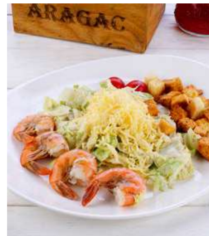
«ЦЕЗАРЬ С КРЕВЕТКАМИ» .....890.- креветки, айсберг, пармезан, черри, соус чесночный, сухарики, 250 г