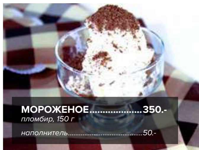
МОРОЖЕНОЕ ..... 350.- пломбир, 150 г наполнитель.....50.-