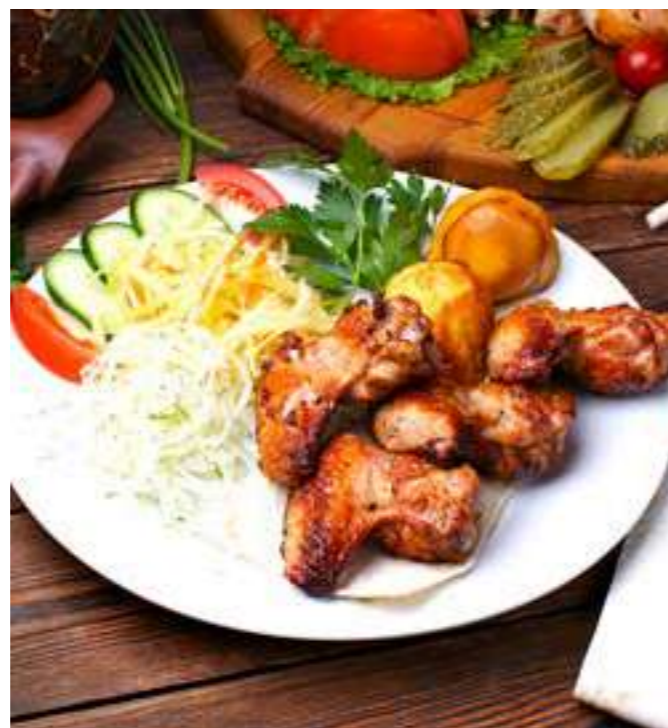
ПИКАНТНЫЕ ..... 690 КУРИНЫЕ КРЫЛЫШКИ румяные куриные крылья, приготовленные на открытом огне, гарнируются запеченным картофелем, 200/250 г