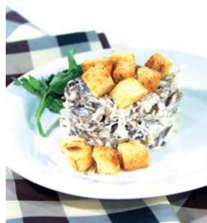
ФИРМЕННЫЙ «АРАГАЦ» ..... 690.- говядина, жареные шампиньоны, маринованный огурец, майонез, сухарики, зелень, 180/10 г

семга с/с, креветка, черри, микс салат, гранат, миндаль, соус наршарап, 220 г