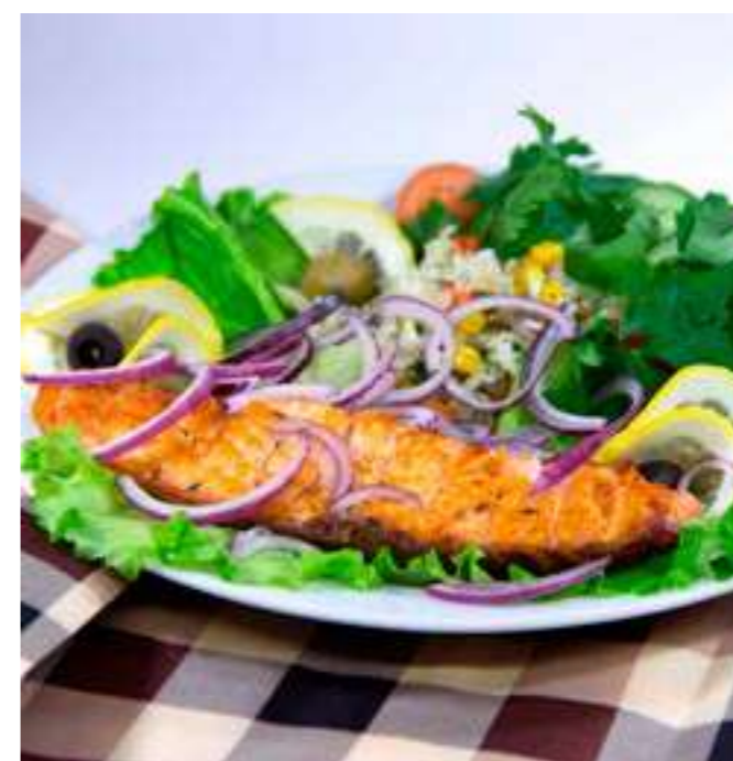
СЕМУЖКА ..... 1300.- НА ВЕРТЕЛЕ сочный стейк из семги, приготовленный на открытом огне, подается с соусом «Тар-тар» и ризотто, 200/50/25 г