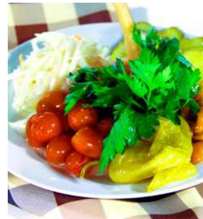
СОЛЁНЫЙ ПИР.....750.- капуста квашеная, опята, черри, огурцы, чеснок и перец маринованные, 315 г