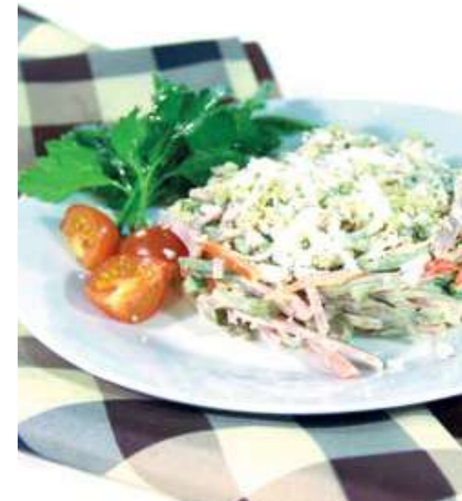
«БАХОР» ..... 750.- говядина, ветчина, болгарский перец, яйцо, свежие помидор и огурец, маринованный огурец, майонез, зелень, 250 г