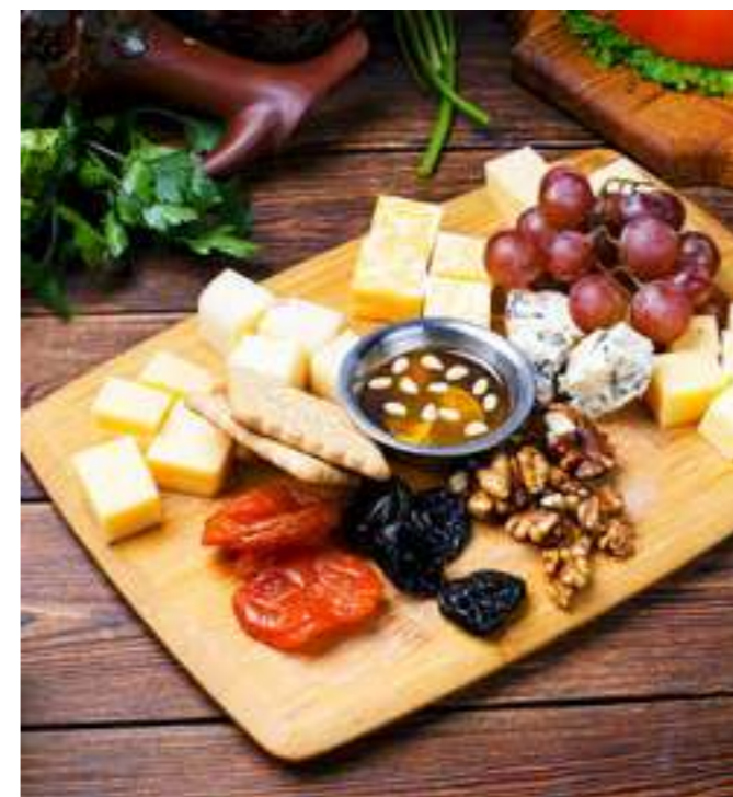
СЫРНОЕ ИЗОБИЛИЕ .....1090.- пармезан, сулугуни, дорблю, гауда, мраморный сыр, курага, орех грецкий, виноград, мед, изюм, 320 г