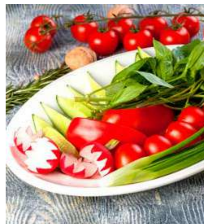
ОВОЩНАЯ КОРЗИНКА .....690.- свежие помидоры, огурцы, болгарский перец, зелень, 330 г