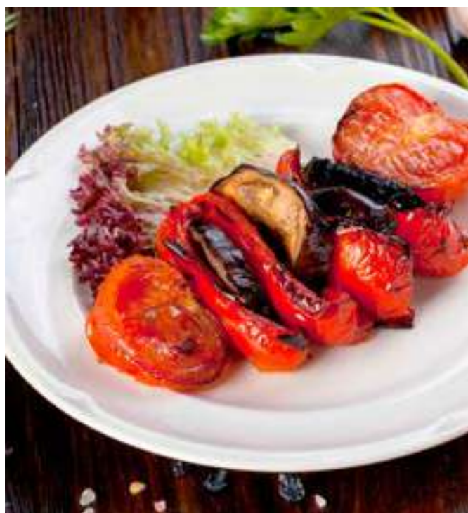
ОВОЩНОЙ ШАШЛЫК ..... 790.- жареные на открытом огне помидор, баклажан и болгарский перец, 300/15 г