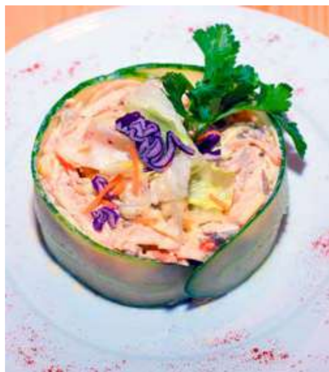
«ГРИБНОЕ ЛУКОШКО».....650.- грузди, говядина, морковь по-корейски, огурец соленый, сметана, лук, 220 г