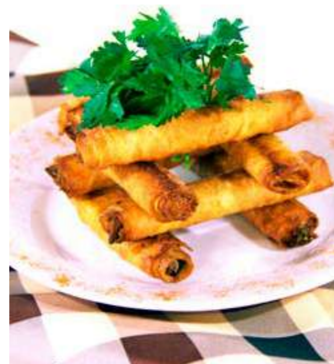
ТРУБОЧКИ С КУРИЦЕЙ ..... 650.- лаваш, куриная грудка, шампиньоны и майонез, 6 шт.