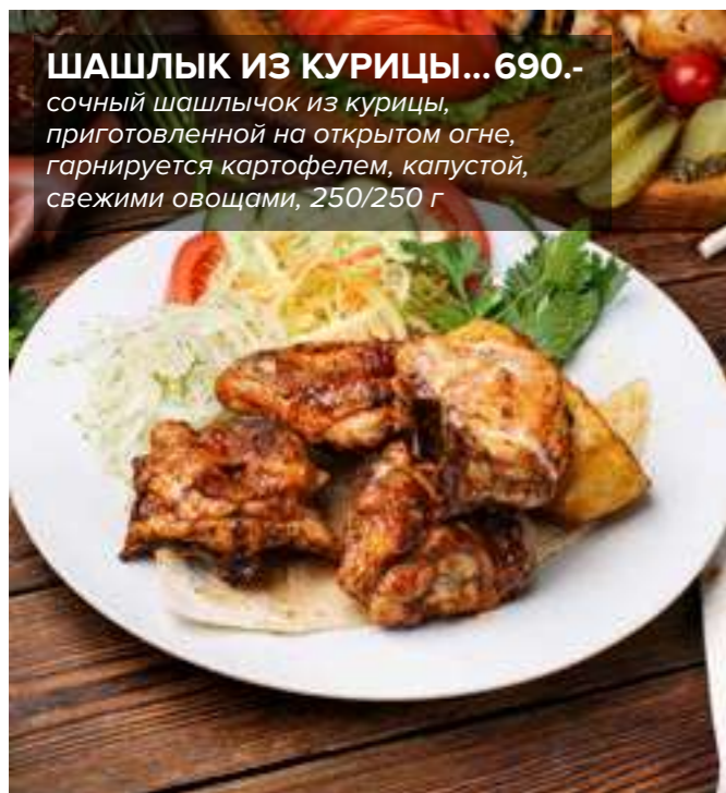
ШАШЛЫК ИЗ КУРИЦЫ... 690.- сочный шашлычок из курицы, приготовленной на открытом огне, гарнируется картофелем, капустой, свежими овощами, 250/250 г