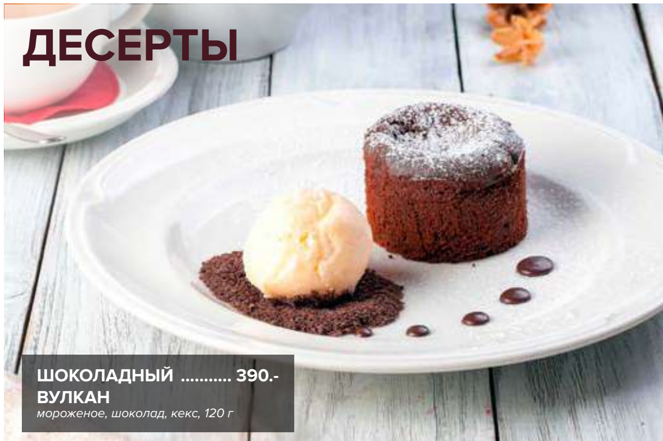
ШОКОЛАДНЫЙ ВУЛКАН ..... 390.- мороженое, шоколад, кекс, 120 г