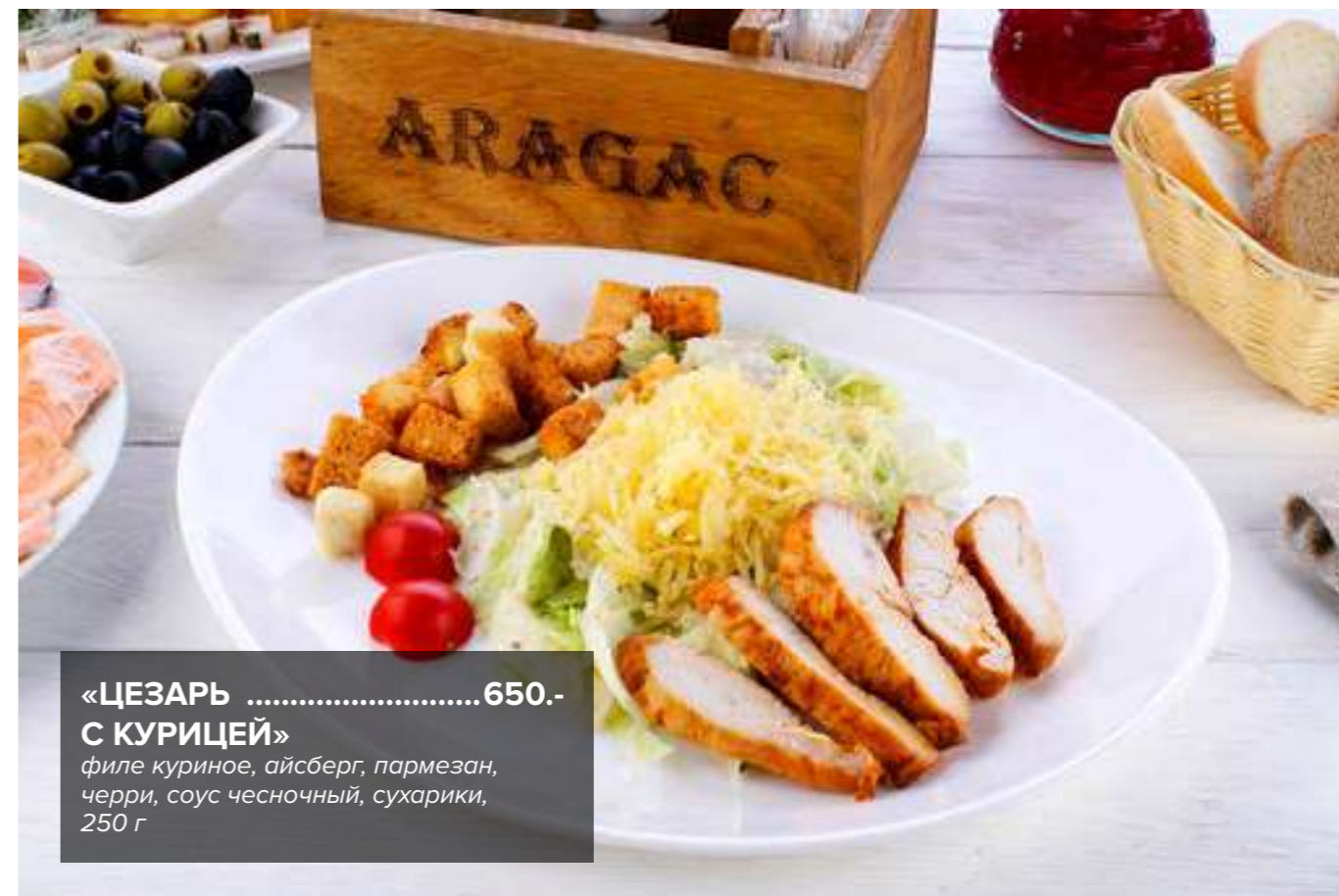
«ЦЕЗАРЬ .....650.- С КУРИЦЕЙ» филе куриное, айсберг, пармезан, черри, соус чесночный, сухарики, 250 г