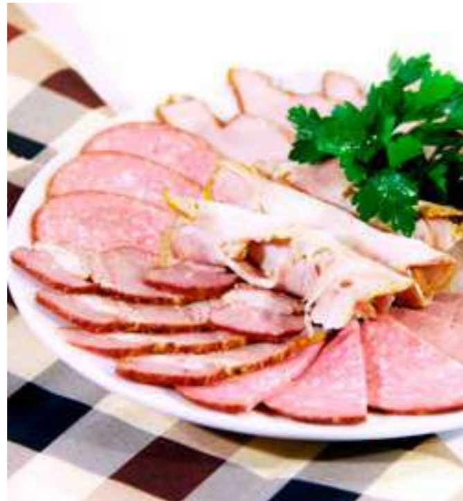
МЯСНАЯ ЛАВКА ..... 1100.- буженина свинина, куриный рулет, ветчина, копченая колбаса, грудинка, зелень, 250 г