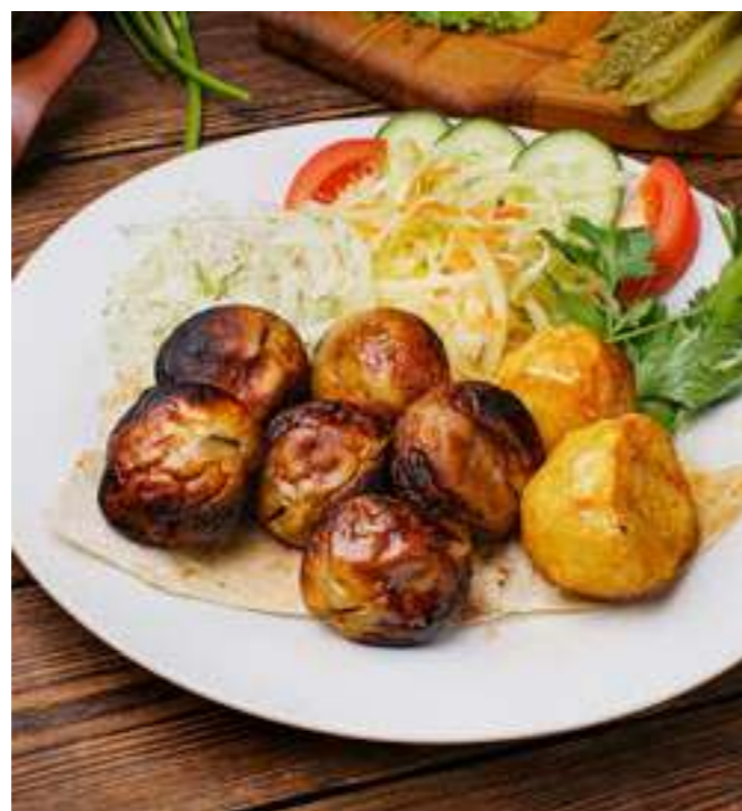
ШАШЛЫК ИЗ ГРИБОВ..... 790.- грибы, лист салата, зелень, 150/50 г